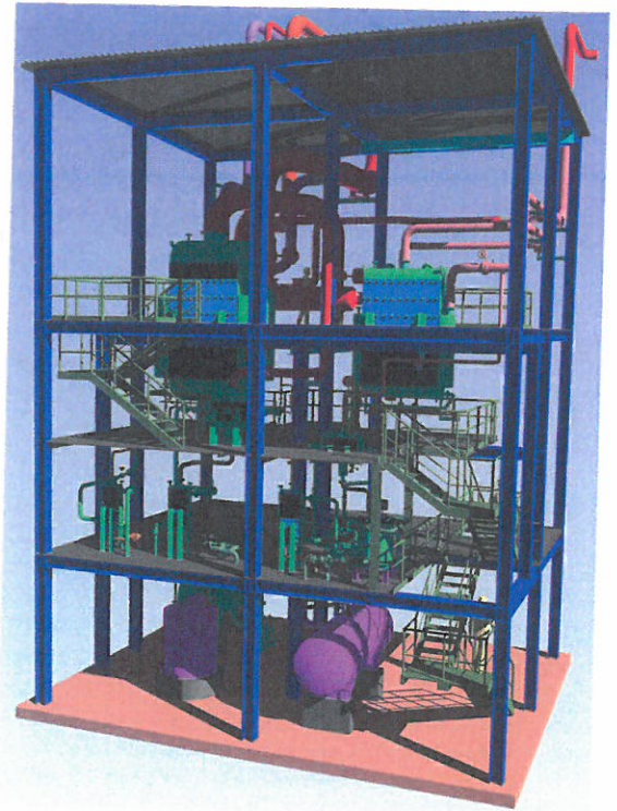
Verunreinigten Prozessdampf aus dem einen Fabrikationsvorgang nutzen, um sauberen Dampf für einen anderen zu erzeugen – das ermöglicht der neue Dampfumformer von VAU Thermotech.

Die Wärmeübertrager sind Teil zweier Dampfumformstationen, die für die Herstellung von Weizenstärke 25 \text{ t/h} Dampf mit 3 \text{ bar} beziehungsweise 8 \text{ t/h} mit 10 \text{ bar} erzeugen. Um hierbei die eingesetzte Heizenergie optimal auszunutzen, wird als Basis überschüssiger Abdampf aus der benachbarten Zuckerfabrik genutzt, um gereinigtes Speisewasser zu verdampfen. Das Wasser wird dafür in drei Stufen vorgewärmt: Zunächst wird die Wärme aus der Abschlammung verwendet, die nötig ist, um Ablagerungen im Wärmeübertrager zu verhindern. Zusätzliche Wärme kommt aus dem anfallenden Kondensat des Heißdampfs, während ein Kondensator die endgültige Temperierung übernimmt. Durch die Kombination wird